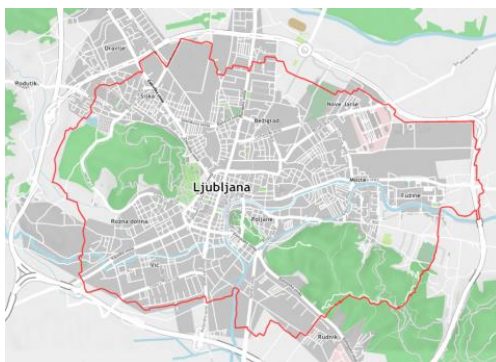
Slika 4: Bodeča žica okoli Ljubljane

Italijanske oblasti so Ljubljano ogradile z bodečo žico, izdale pa so tudi odlok o prepovedi odhajanja iz mesta. Iz mesta je bilo mogoče oditi le s posebnimi prepustnicami.