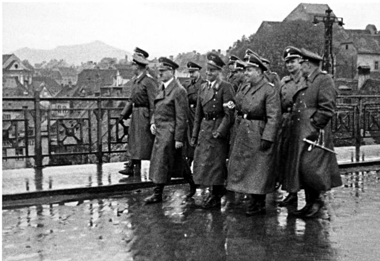
Slika 5: Adolf Hitler med obiskom okupiranega Maribora

Adolf Hitler je želel narediti slovensko deželo zopet nemško. Da bi podkrepil nemški značaj zasedene Štajerske, je 26. aprila 1941 obiskal Maribor, kjer si je ogledal porušena mostova čez reko Dravo in se srečal z mariborskimi Nemci.