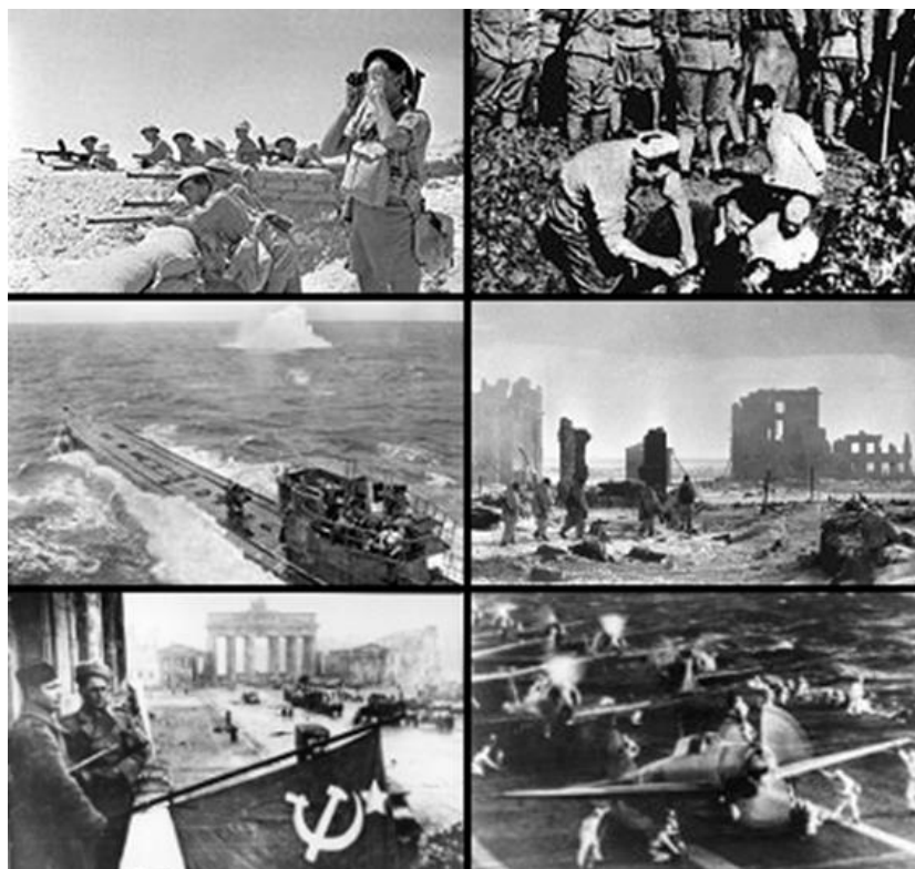
Slika 1: Prizori iz druge svetovne vojne

Glede na odgovore najinih sorodnikov, sva na koncu tri hipoteze potrdili, dve ovrgli in eno delno potrdili.